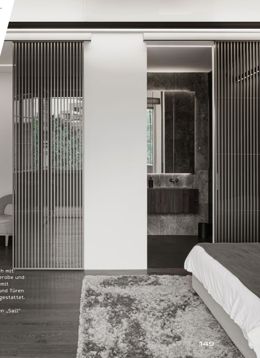
Der Privatbereich mit begehrter Garderobe und Schlafzimmer ist mit Schranklösungen und Türen von Steiniger ausgestattet. Ins Bad führen die Lamellenschiebetüren „Sail“ von Rimadesio