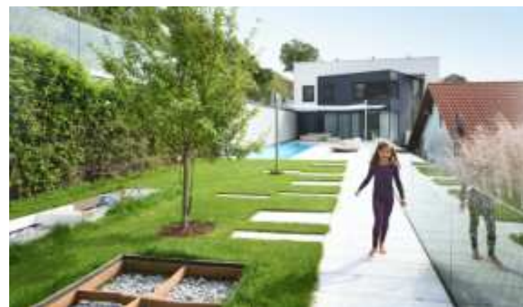
Bild oben: Der schwierigen Hanglage konnte ein geräumiger Garten mit Pool abgetrotzt werden.

der von ihm präsentierten Betonküche erstmals für internationales Aufsehen gesorgt hat, geht es mit der Firma steil bergauf. Im Visier hat man vor allem eine Klientel, die auch über das nötige Kleingeld verfügt, um sich eine Komplettausstattung maßschneidern zu lassen. Bei den Wohnkonzepten von Steinger wird nichts dem Zufall überlassen. Sie sind bis ins kleinste Detail auf die Vorstellungen der Kunden abgestimmt und sollen damit höchste Qualität in allen Projektstadien garantieren.