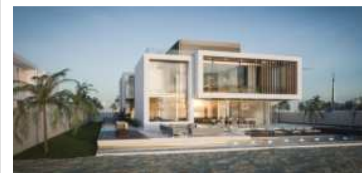
Bild Mitte: Im heurigen April präsentierte Steinger im Rahmen der Salone del Mobile 2019 erstmalig sein neues Küchenmodell „FOLD“. Für seine herausragenden Leistungen erhielt er im Sommer 2019 gleich drei Auszeichnungen: German Innovation Award, H&D Award und den Award Interior Designer International. Bild unten: In Dubai hat Steinger dieses Familiendomizil entwickelt. Das moderne luxuriöse Haus mit heller, verglaster Front bietet einen Blick auf den persischen Golf.