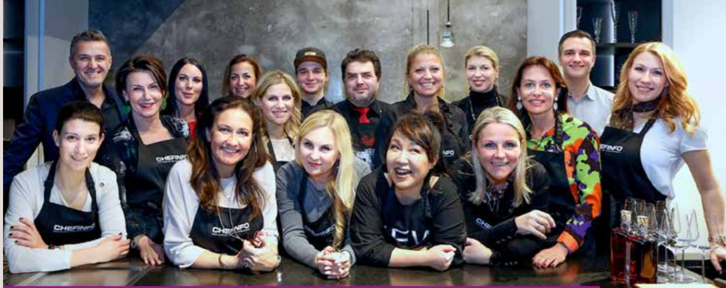
Ein facettenreicher Abend in charmanter Runde mit kulinarischen Highlights vom Restaurant Kliemstein im Salzamt Linz.