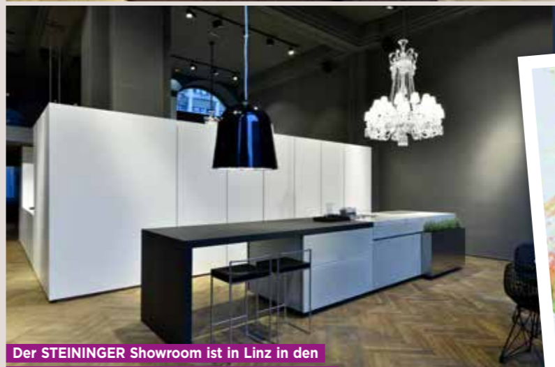
Der STEININGER Showroom ist in Linz in den Räumlichkeiten des ehemaligen Traditionscafés Landgraf. In dem denkmalgeschützten Gebäude trifft puristisch-modernes Interior Design auf historisches Ambiente.