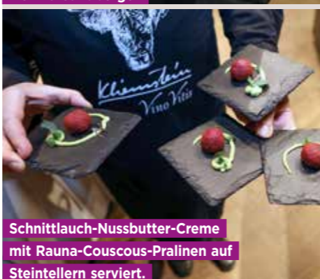
Schnittlauch-Nussbutter-Creme mit Rauna-Couscous-Pralinen auf Steintellern serviert.